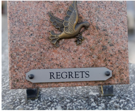
Gravure de plaques funéraires et pierres tombales