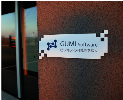
PLV et gravure d'enseignes