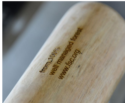
Marquage sur bois