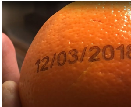
Marquage sur fruits et légumes