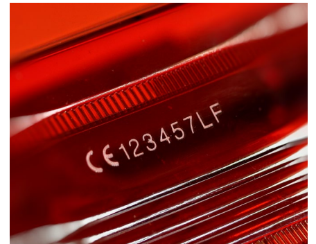
Verre et plastiques transparents