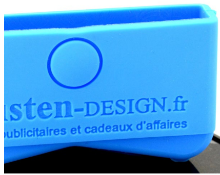
Marquage non contrasté sur les plastiques