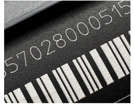
Marquage des étiquettes