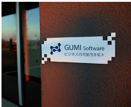
PLV et gravure d'enseignes