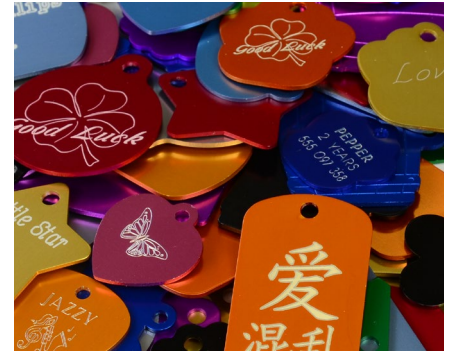
Gravure de médailles pour animaux