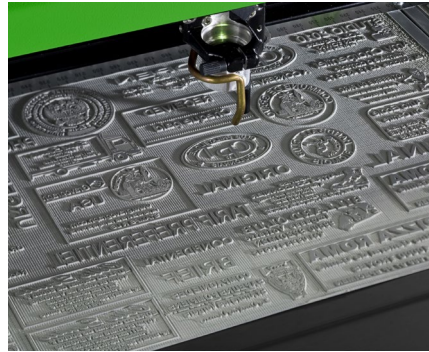
Gravure et découpe laser de tampons en caoutchouc