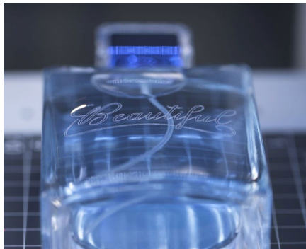
Cosmétique et luxe