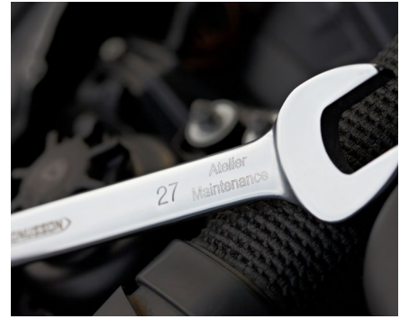
Marquage d'outils pour l'identification et la traçabilité des équipements