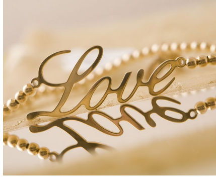
Personnaliser et graver des bijoux