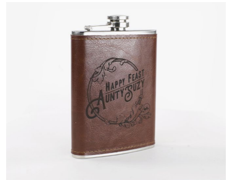
Cadeaux et personnalisation