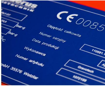
Traçabilité de pièces industrielles