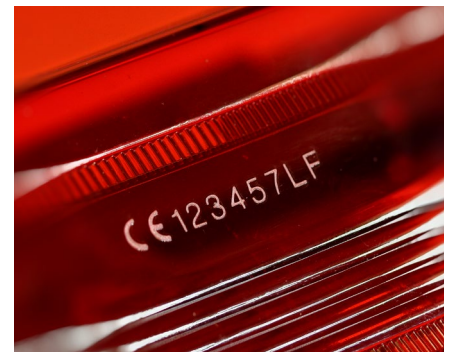
Marquage sur plastiques transparents