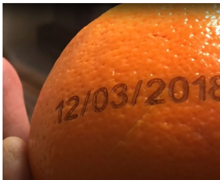
Marquage sur fruits et légumes