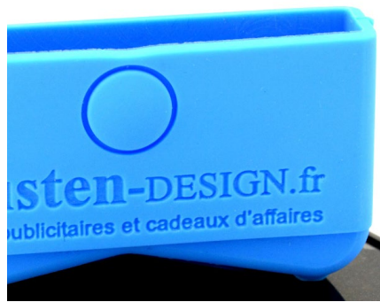
Marquage non contrasté sur les plastiques